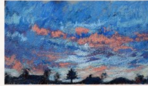
Pastel de Guylaine Jacques

418.426.3357 poste 101 municipal@saint-frederic.com